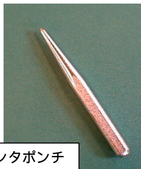
センタポンチ 穴や円弧の中心の 位置を決める