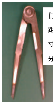
けがき用コンパス 距離や円弧のをけがく。 寸法を移したり長さを 分割したりできる。